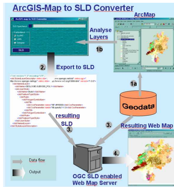
Abb 1. Prozessdiagramm: Design einer Karte in ArcMap, Export derselben in ein SLD Document. Dieses kann genutzt werden, um WMS Server zu konfigurieren oder Nutzerspezifische Darstellungsanfragen per SLD an SLD-WMS zu senden.